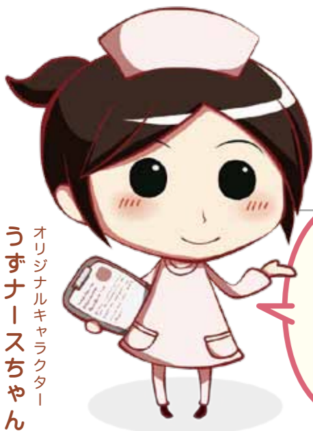
オリジナルキャラクター うづナースちゃん